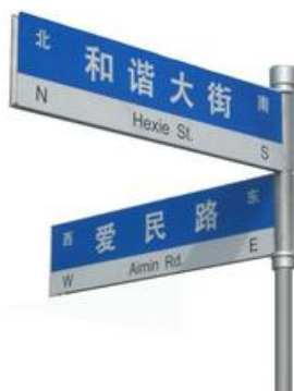
图 4.4.2-2 转角处设置路名牌样式示意图

4 根据《城市道路交通标志与标线设置规范》（GB 51038）4.3.6.1 规定，在人行道上，行驶机动车类型为行人时，交通标志板面下缘至路面最小净高为 2.5m。4.3.6.3 规定，当设置于人行道、非机动车道侧时，标志板下缘距离路面的高度应不小于 1.8m。通过与威海市交警部门对接，目前威海市威海市现有路名牌均按照 2.1m 净高设置。故本导则要求路名牌净高不小于 2.1 米。